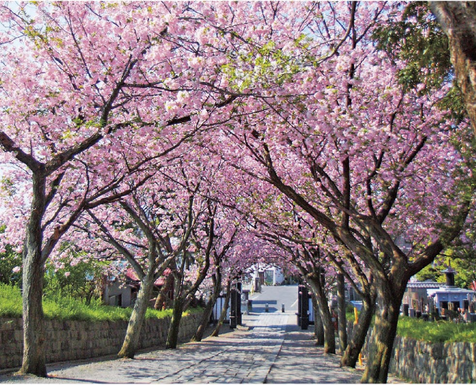
参道四十八段のいろは坂は、春には桜のトンネルに