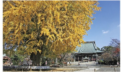
高さ21mの大イチョウは市指定天然記念物