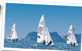
▲2020年のオリンピックセーリング競技会場は藤沢市江の島です