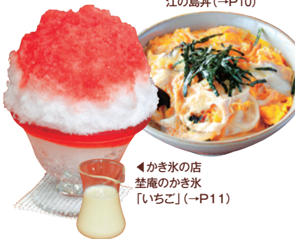
◀かき氷の店 荳庵のかき氷「いちご」(→P11)