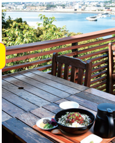
▲Café Madu 江の島のテラス席

江の島やビーチ沿いを走る国道134号線周辺には、潮風に吹かれ絶景を楽しみながらグルメやスイーツを味わえるスポットが多数。