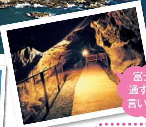
▲江の島の最奥部にある神秘的な江の島岩屋