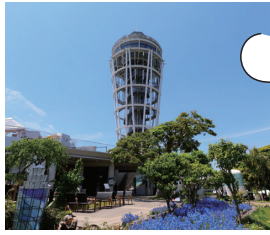
江の島サムエル・コッキング苑 ●片瀬江ノ島駅 MAP P25-D-4

明治時代にイギリス人貿易商サムエル・コッキング氏が造成した、西洋と和の要素が融合した庭園跡。充実した体験エリアでは、歴史や植物について楽しみながら学ぶことができる。