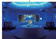
クラゲファンタジーホール