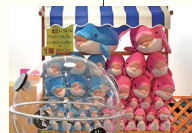
オリジナルグッズも充実