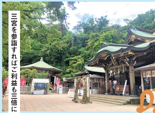
三宮を参詣すればご利益も三倍に

国藤沢市江の島1-4-12 ☎0466-47-6769(1F)、0466-47-6761(2F) ☎10:00~18:00 ㊦㊧ ㊨片瀬江ノ島駅より徒歩12分