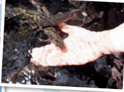
⑤「さかなのもぐもぐプール」では餌やり体験も