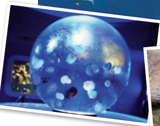
①神秘的なクラゲの展示コーナーも