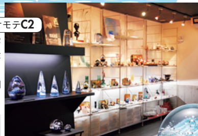
①作家それぞれの個性が光る作品が並ぶ ②北斎珠>凱風快晴3万8500円 ③透き通るような青が美しい作品もある

④藤沢市菖蒲沢710 ⑤小田急江ノ島線湘南台駅から徒歩10分 ⑥入場無料 ⑦10~17時(要予約) ⑧不定休 ⑨3台