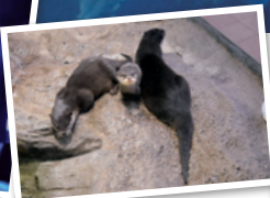
②コツメカウソウの親子