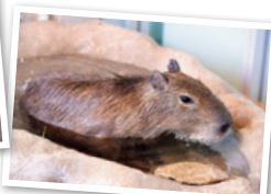
③カピバラも子どもたちに大人気