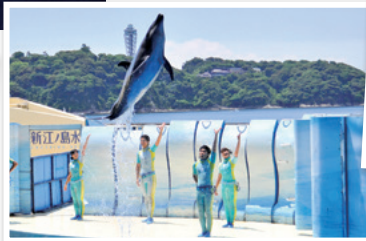
④イルカアシカショー「きずな/kizuna」