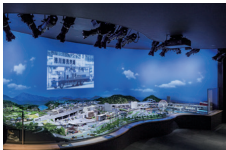
①本物そっくりのミニチュアカーが走るジオラマ

クーポン ワンデイスパ 10%OFF ※1冊につき5名様まで有効 2021年8月31日まで