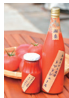
①真っ赤に完熟したトマトは栄養も満点だよ ②トマトジュース720ml1500円とトマトケチャップ300g972円

URL https://www.idetomato.com/tomato_picking