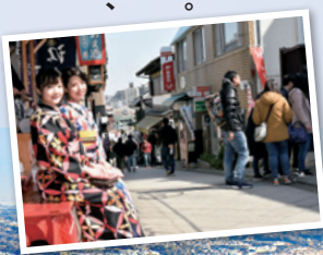
江の島弁財天仲見世通りの老舗の和菓子店でひと休み

美しい海と江の島は湘南を代表する絶景スポット。しらすをはじめとした海の幸や農産物などのグルメ、そしてショッピング、歴史ある街並み。そんな底知れない藤沢の魅力堪能しよう!