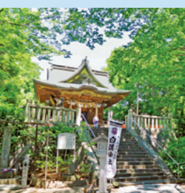
深い緑に包まれた白旗神社(→P9)でのんびり

江戸時代には東海道五十三次の6番目の宿場町だった藤沢市内には、旅人たちが賑わった宿場町ならではの寺社や歴史スポットなどが数多く残されている。古きよき風情を感じながらのんびり散策してみよう。