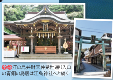
江の島弁財天仲見世通り入口の青銅の鳥居は江島神社へと続く