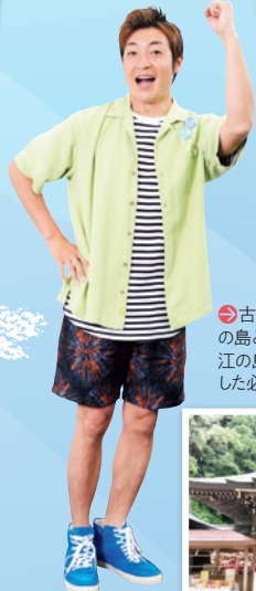
古くから伝統と信仰の島として知られている江の島は楽しみが凝縮した必見スポット