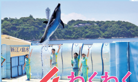
新江ノ島水族館(→P15)で動物たちと遊ぼう

水族館や癒やしスポットなど、家族みんなが、思いきり楽しめる自然や施設が充実。メンバーの人数や年齢に合わせて、みんなで遊べるスポットを選びたい。