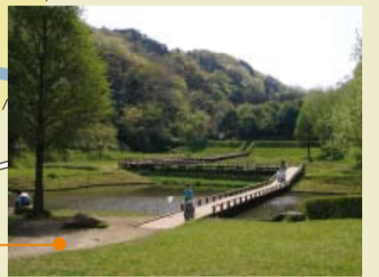
新林公园 川名 411-1 TEL.0466-27-4437 离藤泽市中心不远的地方,至今仍留有一片广阔的自然公园。那里生息了许多鸟类,深受鸟类爱好者的喜爱。同时还有被移筑保存的江户时代旧民房,自然和传统有机地融为一体,使人感慨而流连忘返。另外,还可以利用旧民房开茶会。