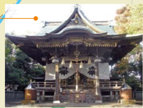
白旗神社 藤泽 2-4-7 TEL.0466-22-9210 传说义经的头颅在腰越证实属本人之后被丢弃。爱怜义经的人们捡回头颅埋入坟里,之后建立了白旗神社来祭祀他的灵魂。