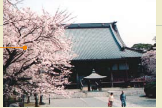
遊行寺 西富 1-8-1 TEL.0466-22-2063 遊行寺系日本观光百选之一。是镰仓时代一遍上人(1239~1289年)开创的佛教宗派之一时宗的总本山,之后又由四代吞海上人创建。登上48级台阶后是宽阔的寺院,里面有宝物馆、历史遗迹、文化财产等许多值得一看的地方。