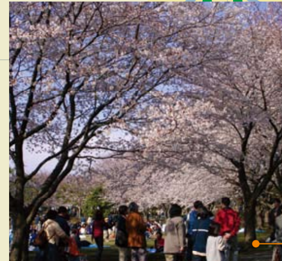
大庭城址公园 大庭 5230-1 TEL.0466-87-9500 古时候曾被叫作大庭城山。以宽阔的大草坪广场为主。有小孩子冒险广场和鲜花广场。春天里山樱、染井吉野樱的赏花时节非常热闹。