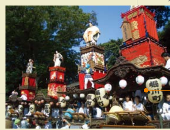
皇大神宫 鹤沼神明 2-11-5 TEL.0466-24-5590 偶人彩饰花车和汤华古典舞乐的相典是每年8月17日举行。三层式偶人花车的台有8米高。日本式雕刻屋檐下挂着灯笼,顶上立着偶人随着乐曲伴奏列队游行。陈列有源朝和德川家康及其他有名人物的9座偶人。