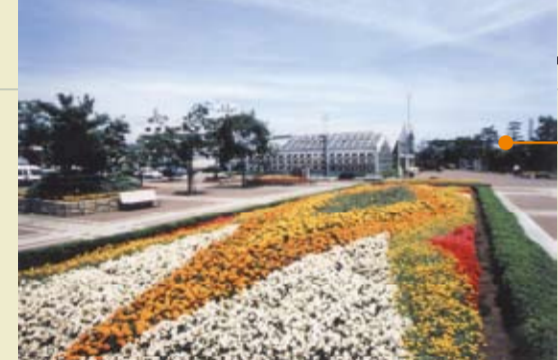
长久保公园 (都市绿化植物园) 迁堂 太平台 2-13-35 TEL.0466-34-8422 位于绿化普及中心区域内,有植物墙标本制成的迷宫、鲜花散步路、溪流广场、还有可以一望江之岛的展望广场。