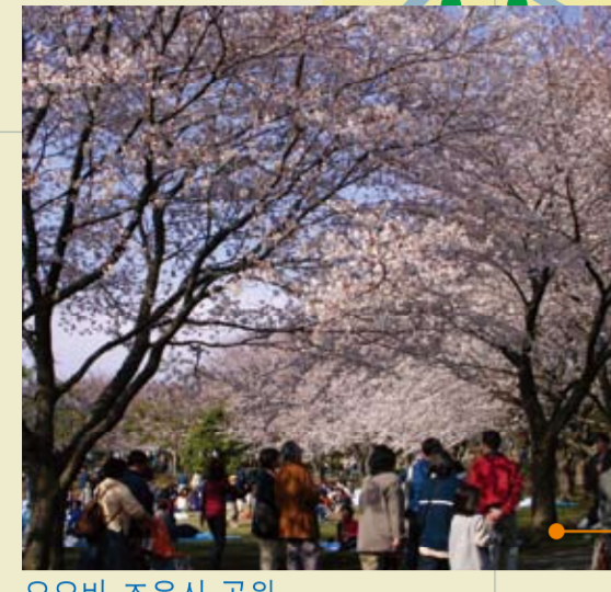
오오마 조유시 공원 오오마5230-1 TEL.0466-87-9500 여로부터 '오오마시야마'라 불리며 광대한 잔디 광장을 중심으로 어린이 모험 코너, 꽃의 광장이 있습니다. 특히 벚꽃이 유명하여 봄에는 관광객들로 아주 많이 붐빕니다.