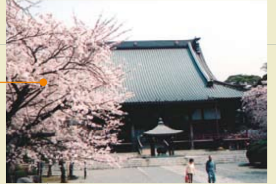
유교우지 니시토미 1-8-1 TEL.0466-22-2063 시종(時宗, 지슈)충분신인 이 절은 일본 관광 백선 중의 하나이며 가마쿠라(鎌倉)시대 때 '잇벤상인(上人)'에 의해 알려진 '염불문' 종파인데 훗날 사대 후손인 '돈카이상인'에 의해 창건되었습니다. 48개의 계단을 시작으로 넓은 경내에는 보물관 및 불مان 사적, 문화재가 많이 있습니다.