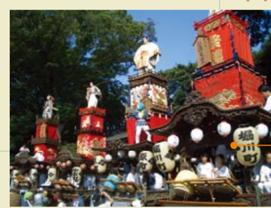
황대신궁 구게누마신에이 2-11-5 TEL.0466-24-5590 인형을 장식한 가마와 유바나 고전무악의 제전은 매년 8월17일에 행해집니다. 인형 가마는 높이 8미터의 3층식으로, 조각이 새겨진 일본풍 지붕에는 제등을 장식하고, 가마 꼭대기에는 인형을 세워 하사시(음악)에 맞추어 행렬합니다. 인형은 미나모토노요리토모, 도쿠가와 이에야스 등 충 아홉 개가 정렬됩니다.