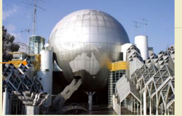
쇼난다이 문화센터 쇼난다이 1-8 TEL.0466-45-1500 어린이관에서는 플라네타륨·민족의상 코너 등이 마련되어 있으며 이는 어린이들의 꿈을 키워 줍니다. 또한 '시민극장'은 높이 24미터의 큰 공간과 변형 무대로 세계 어디에서도 보기 드문 구형(球形) 극장입니다.