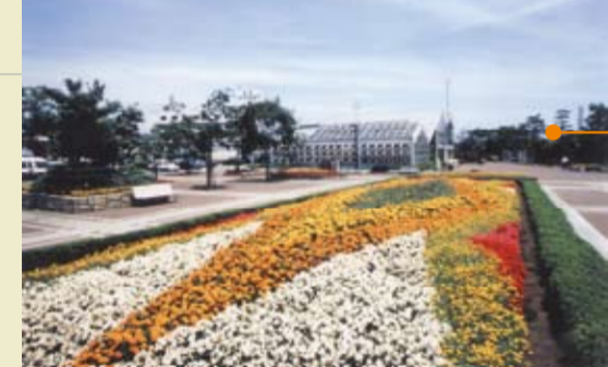
나카부보 공원 초지도우 다이헤이다이 2-13-35 TEL.0466-34-8422 도시 녹화 식물원으로 녹색 보급센터 내에 위치함. 미로를 걷는 울타리 표본 정원, 꽃의 산책로, 계곡이 있는 광장 그리고 에노시마를 한눈에 바라볼 수 있는 전망 공원 등이 있습니다.